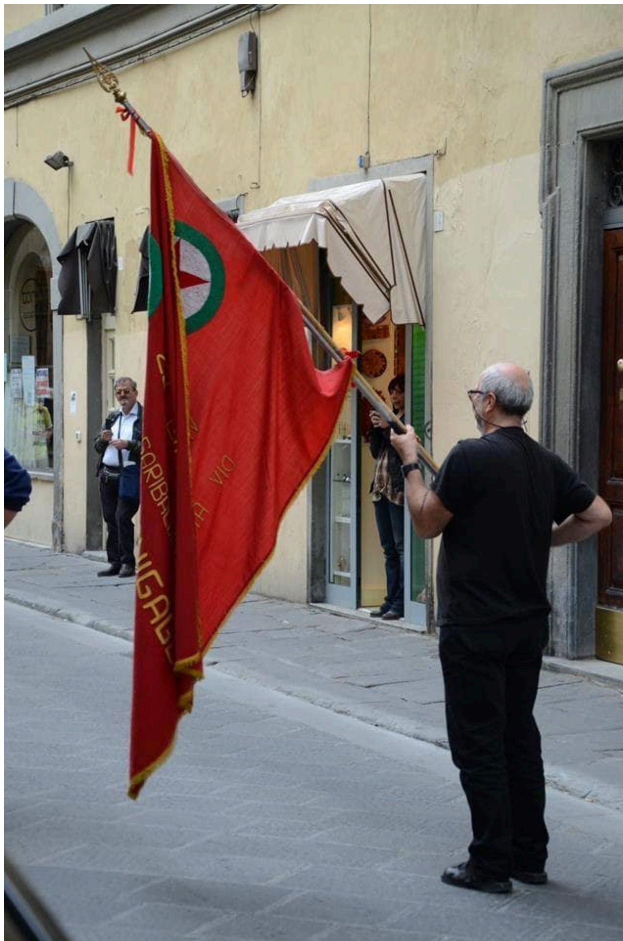
Centro Popolare Autogestito CPA Firenze Sud Non un minuto di silenzio ma una vita di lotte! | 1