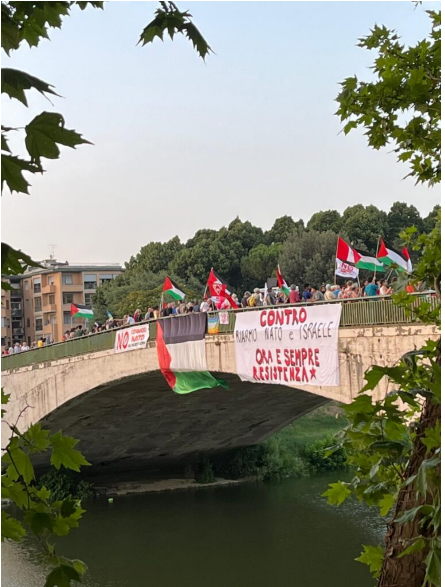
Centro Popolare Autogestito CPA Firenze Sud Firenze Antifascista sulle ultime denunce | 2